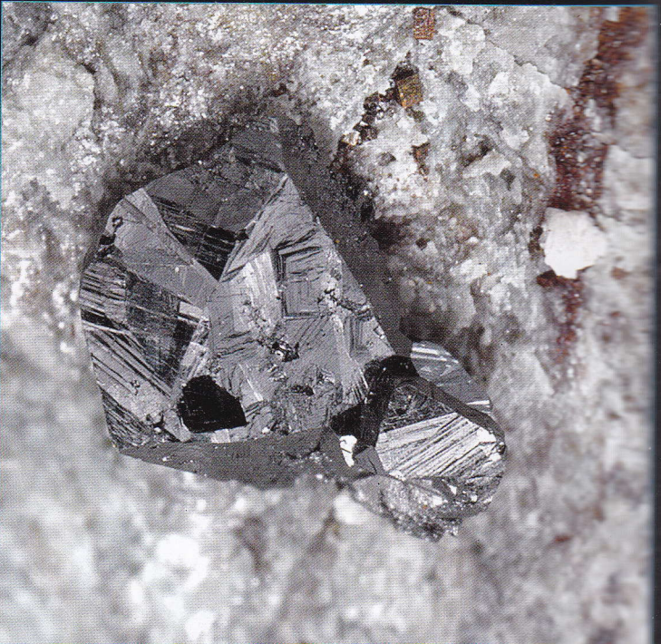
Minéral du groupe de la crichtonite - 5 x 5 mm La Fée, les Deux-Alpes, Mont-de-Lans, Oisans, Isère Coll. : E. Asselborn