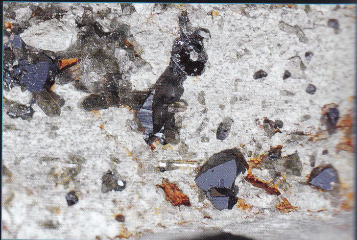
Minéral du groupe de la crichtonite - Cristaux : 2 mm La Fée, les Deux-Alpes, Mont-de-Lans, Oisans, Isère Coll. et photo : S. Vein