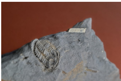
Placoparia sp. et cristal d'andalousite, Fov 8cm. Les Salles de Rohan, Morbihan, Bretagne, FRANCE

Article 14 : L'inscription implique l'acceptation sans réserve du présent règlement.