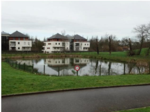
Vue de l'étang au pied de la salle.