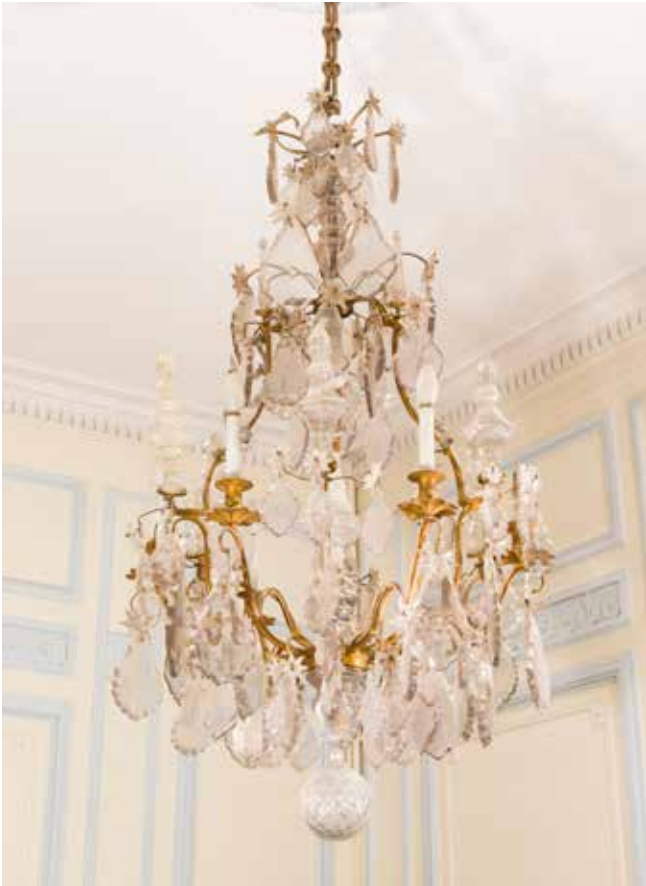
458 - Lustre en bronze à six feux de lumières retenant des pendeloques, poignards et boule, en cristal taillé, gouttes XIXème siècle. Style Louis XV