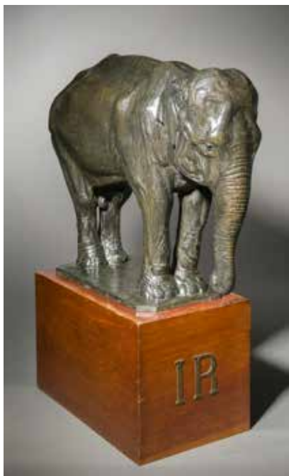
Rembrandt BUGATTI (1884 – 1916) Eléphant au repos – Circa 1909 - 1910 Sculpture en bronze