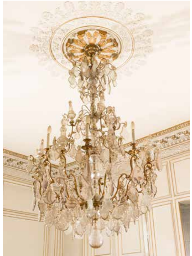
459 - Grand lustre cage en bronze doré à huit feux de lumières retenant des pendeloques, poignards et boule en cristal taillé et gravé. XIXème siècle. Style Louis XV