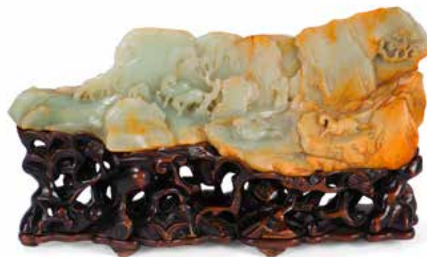
GRUPE EN JADE CÉLADON VEINÉ DE ROUILLE Chine, époque Qianlong. H. 12,7 cm - L. totale 37,2 cm