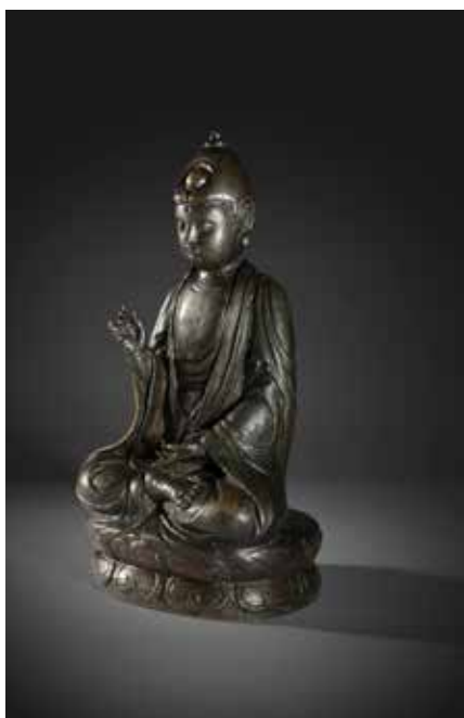
RARE ET EXCEPTIONNELLE STATUE EN BRONZE CISELÉ ET DE PATINE NOIRE Bouddha Assis Chine. Empire Xixia, IX-XIème siècle. H. 28,5 cm