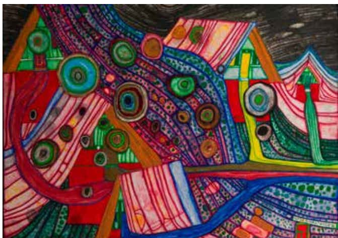
Friedensreich HUNDERTWASSER (1928-2000) The ways to Santana - Les toits d'un violet nostalgique Février 1973 - Septembre 1973 Technique mixte. Signé. 44 x 62 cm