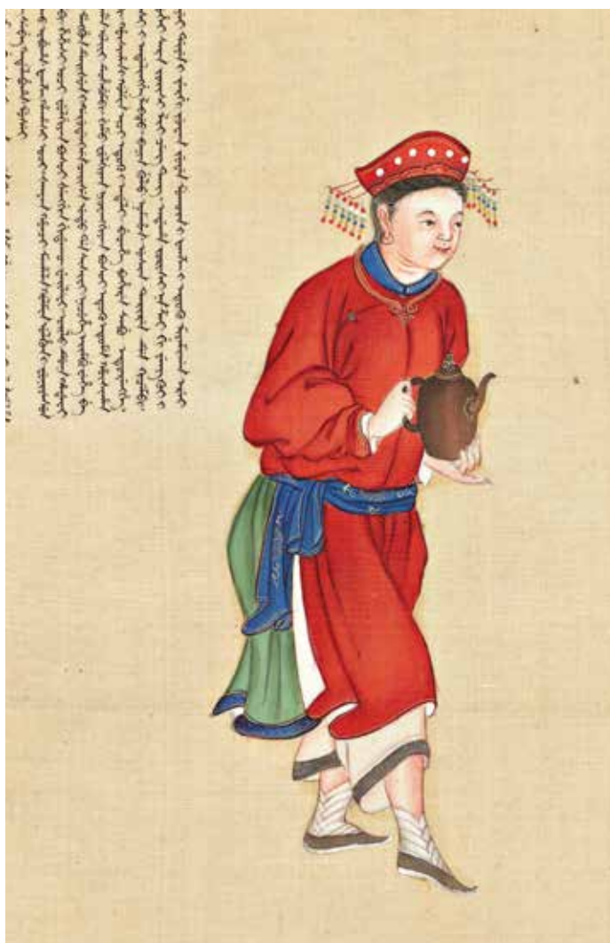
Rare album impérial zhigongtu Chine, période Qianlong, (1735-1796)

Expertises gracieuses et confidentielles Sur rendez-vous à notre étude - Tél. : 01 40 20 02 82