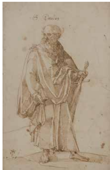
Tobias STIMMER (1539-1584) Saint Paul Plume et encre brune