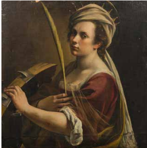
Artemisia GENTILESCHI (Rome 1593-Naples 1652) Sainte Catherine d'Alexandrie. Huile sur toile.