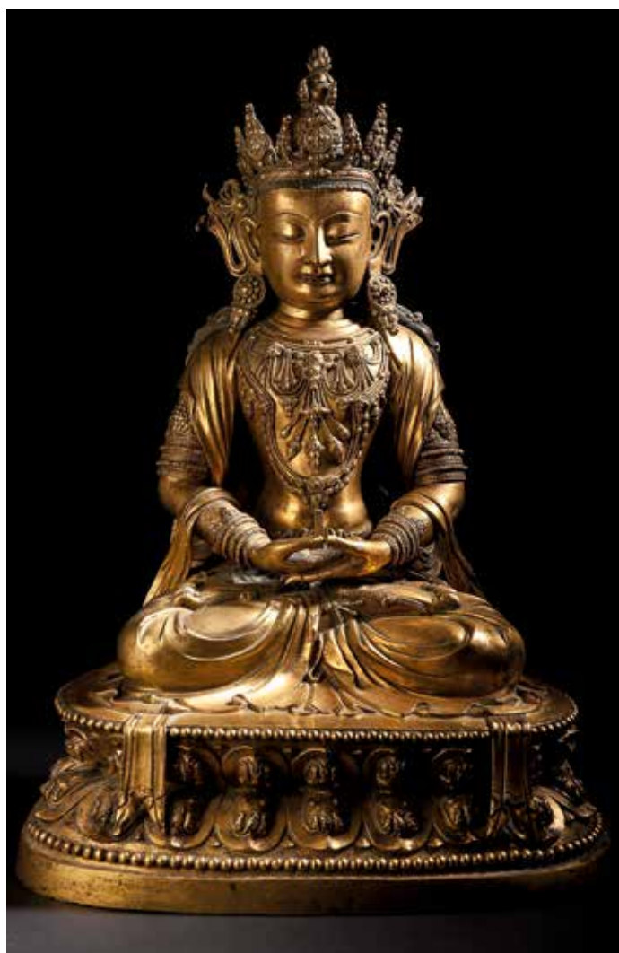
Amitayus, importante statue en bronze Chine, période Kangxi, (1661-1722)