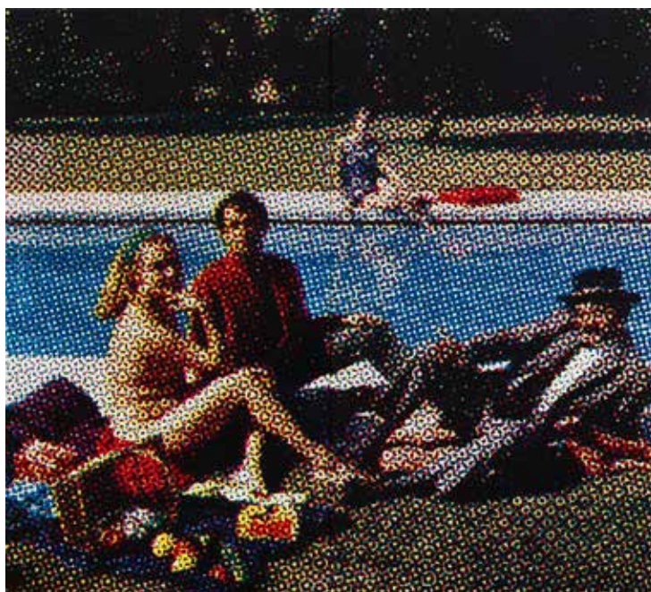
Alain JACQUET (1939-2008) Le déjeuner sur l'herbe - 1964 Sérigraphie sur papier maroufflé sur toile. 175 x 196 cm