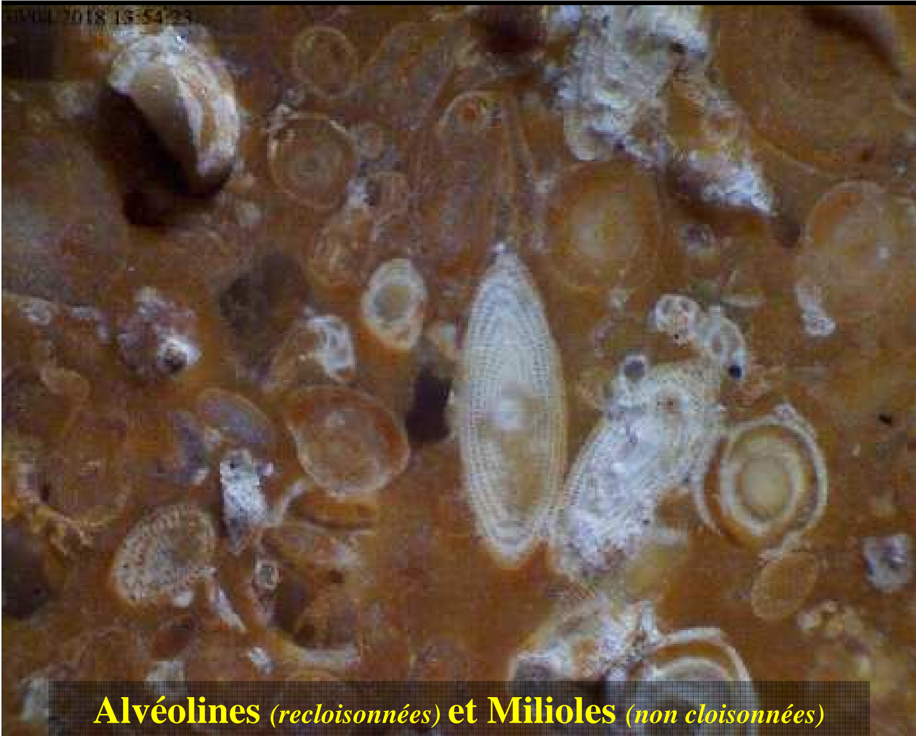
Alvéolines ( reclouonnées ) et Milioles ( non cloisonnées )