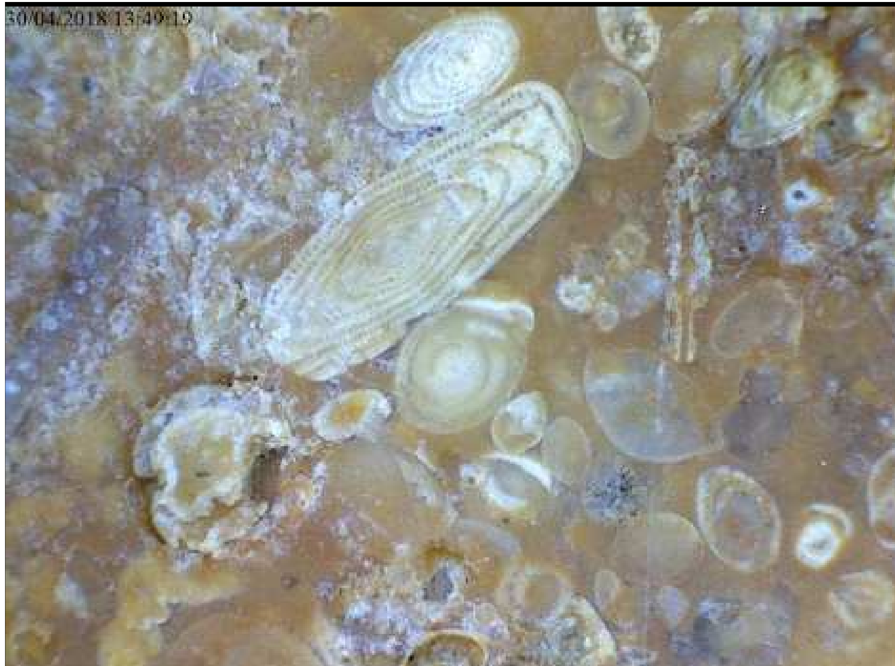
Alvéolines ( reclouisonnées ) et Milioles ( non cloisonnées )